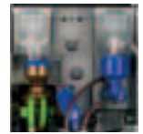
Version Fresh Brew